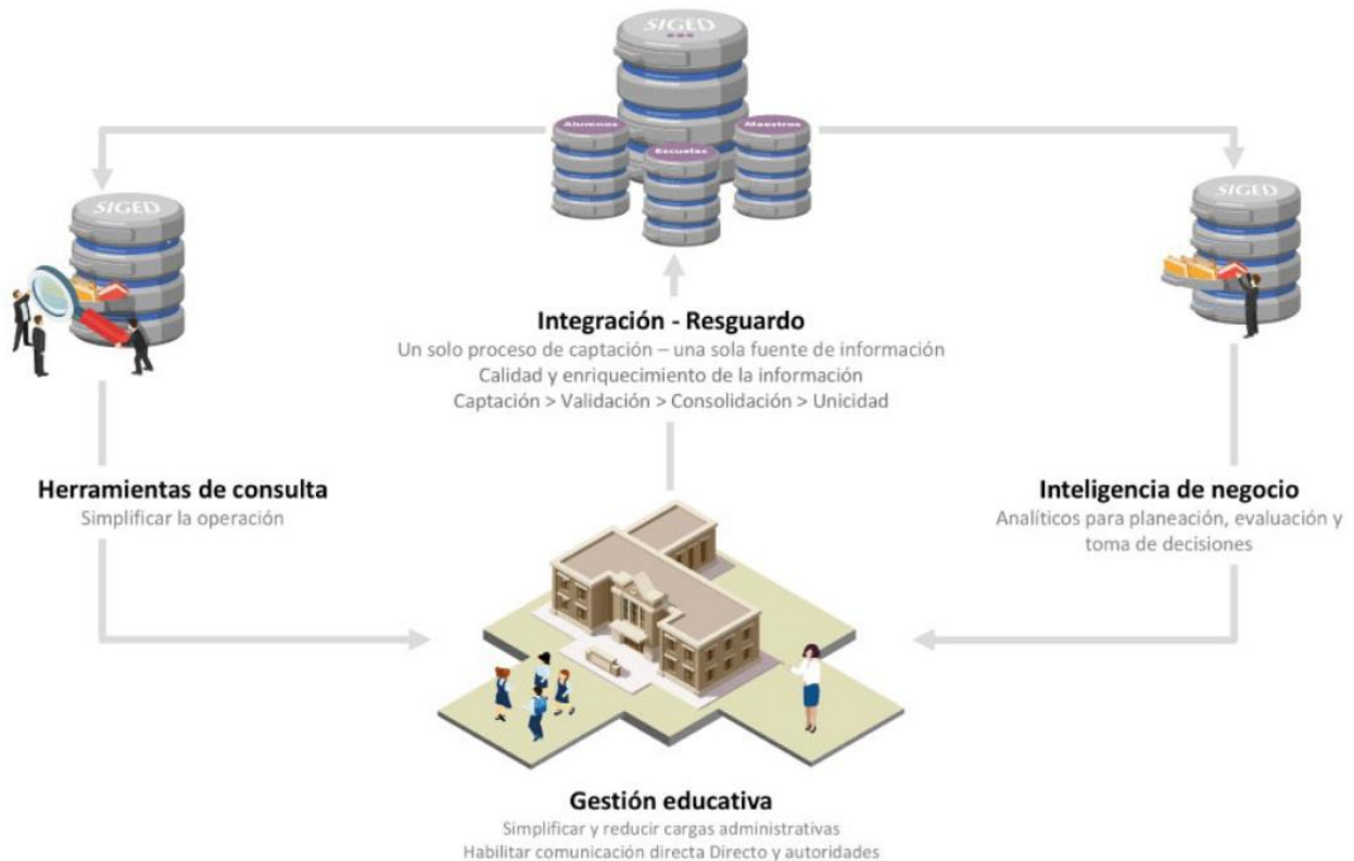
Ilustración 1. Modelo operativo del SIGED.